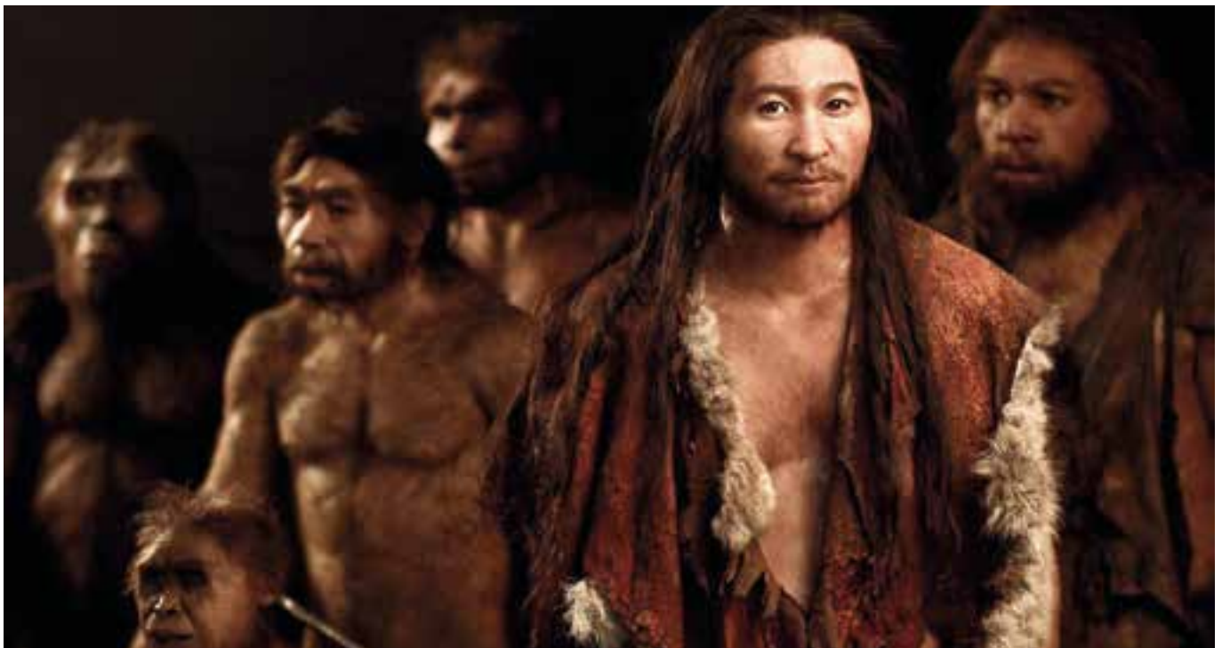
Ricostruzione moderna dell'uomo Sapiens.

Essendo ancora sprovvisti di gommoni e scafisti ... il mare costituiva un ostacolo insormontabile per la prosecuzione della loro migrazione verso nord; così i sapiens dovettero deviare verso est, passando per il Sinai ed il Medio Oriente dove incontrarono i primi neanderthal. Da lì dila-