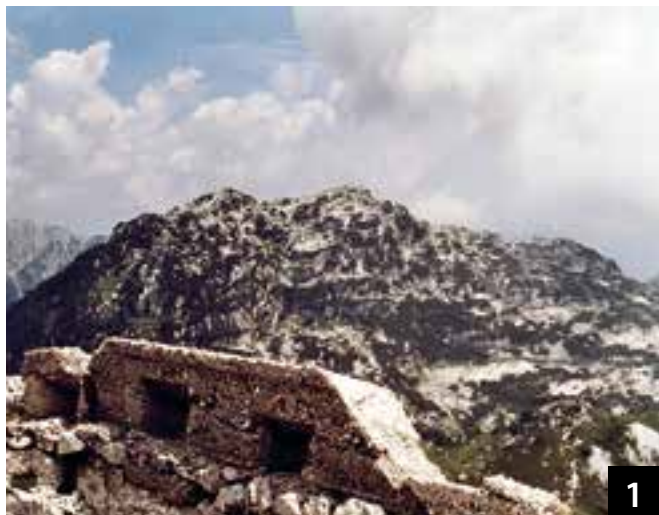
La Mogenza Piccola dalle trincee corazzate del Robon.