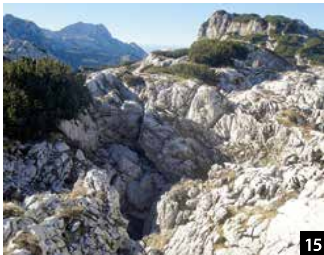
Pozzi e forre tipici del monte.