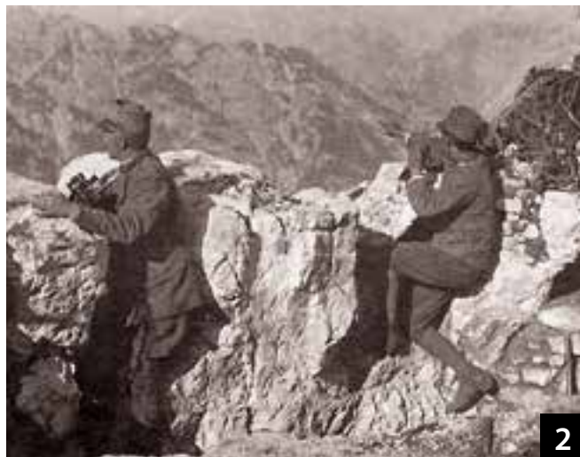
Posto di osservazione italiano sulla cima.