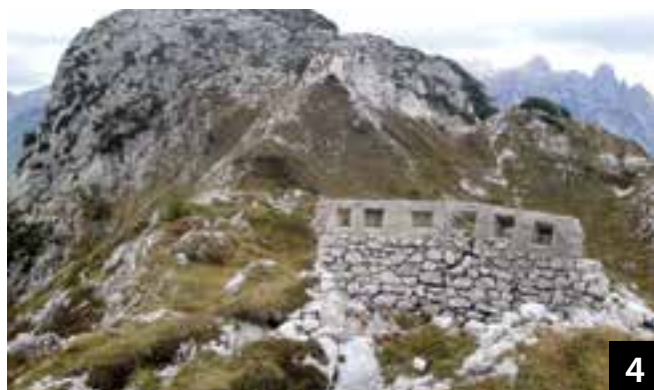
Postazione con feritoie in cemento armato.

Vista la valenza strategica del monte che offriva un eccellente punto di osservazione per l'artiglieria sulle linee austriache [in foto 2 osservatorio presso la cima con sullo sfondo le Vette Scabre - foto 3 attuale circa dalla stessa posizione], il Robon assunse carattere di importante caposaldo e fu munito di