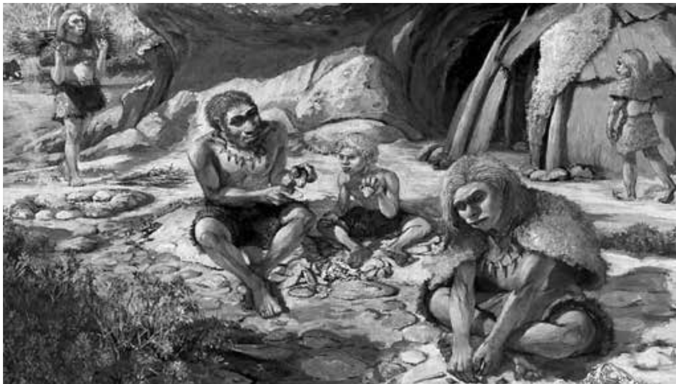
Rappresentazione dell'uomo di Neanderthal.

garono in tutte le direzioni ed in particolare verso l'Europa.