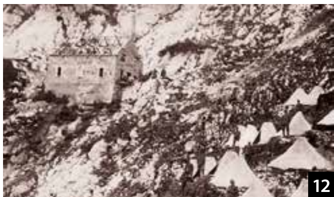
Casermetta in costruzione.

Infine sotto il Robon, si può salire fuori sentiero direttamente all'attuale bivacco Modonutti Savoia, che funge da base per le ricerche speleologiche e per gli studi sui fenomeni carsici, incontrando così cumuli di scatolame arrugginito [foto 11] e contorti resti di contenitori con ganci e passanti utili per il trasporto. Qui, volgendo lo sguardo a sinistra, si scorgono le rovine di quella che doveva essere una casermetta e che nella foto 12 d'epoca sembra ancora in fase di costruzione; aspettando il completamento dell'opera, la truppa era acquartierata, come si può vedere, in un complesso di tende. Questo fa pensare che la foto si riferisca ai primi mesi del conflitto.