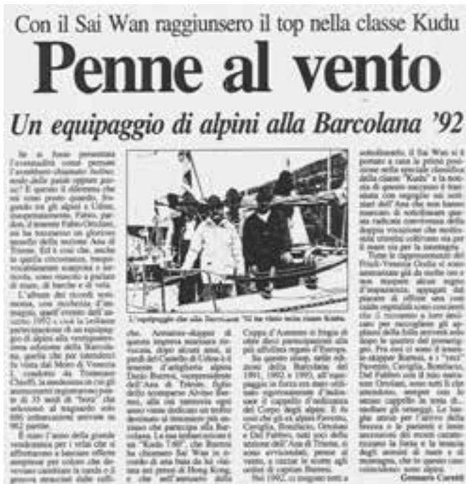
Ritaglio del Messaggero Veneto del 29 maggio 1996.

E' stato l'anno della grande vendemmia per i velai che si affrettarono a lanciare offerte strepitose per coloro che dovevano cambiare la randa o il genova stracciati dalle raffiche.