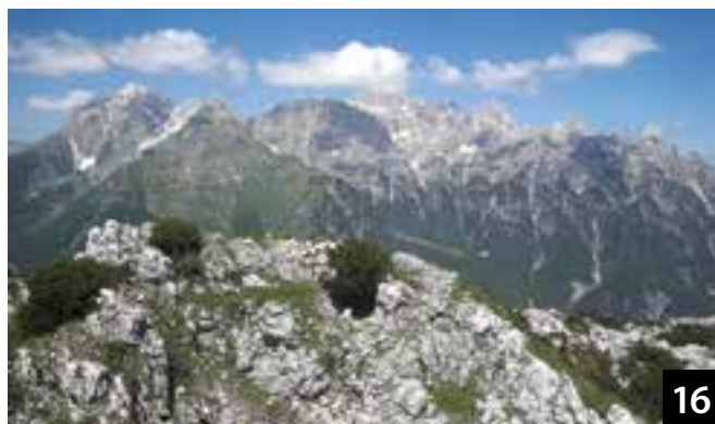
Bella vista su Montasio e Fuart.

L'attuale foto 13 mostra i resti dell'ex casermetta, che quasi si mimetizza con l'ambiente circostante, e l'attiguo pendio dove erano sistemate le tende; più visibile in foto 14 scattata dall'alto.