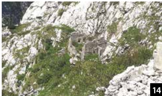
Come foto 13 presa da diversa posizione.