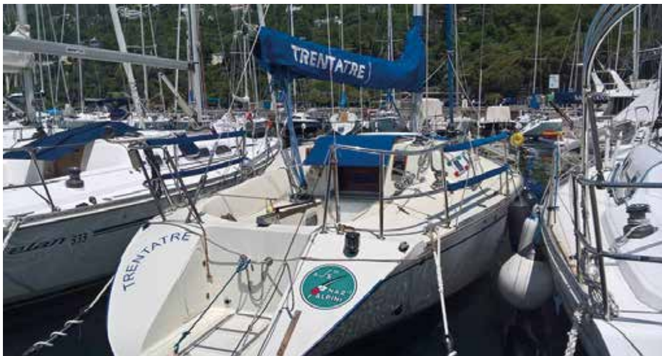
Trentatre, la nuova barca.