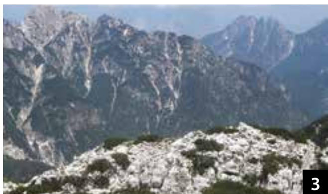
Circa dalla posizione della foto.

Gli Austriaci si erano arretrati preventivamente su terreno più atto alla difesa [erano molto abili in questo] e nel caso specifico sulla cima della Mogenza Piccola [vista in foto 1 dal monte Robon]. Sempre nei primi giorni, altri reparti alpini avanzavano fino alla sella Prevala che diverrà così un punto chiave per il collegamento con le posizioni del Cukla, attraverso il cosiddetto "Sentiero dell'Aquila". I due schieramenti erano separati dall'ampio avvallamento della sella Mogenza. Gli Italiani avevano allestito