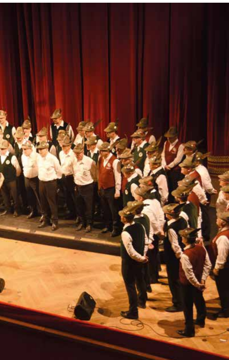
erdi di Trieste.

zio americano ed europeo, da "Oh Holy Night" a "Stille Nacht", fino a "Pensieri e parole" di Battisti.