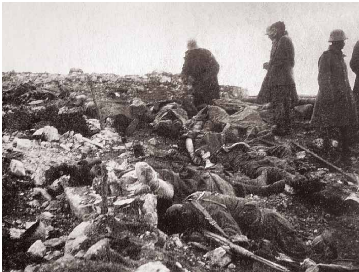
Monte Ortigara. Caduti italiani dopo l'attacco austriaco del 25 giugno 1917.

tenere il minimo successo: ormai il destino dell'Ortigara era fatalmente segnato. La lotta fu accanita, dalla baionetta al corpo a corpo, sino a precipitare avvinghiati giù nei ripidissimi canali che scendono in Valsugana.