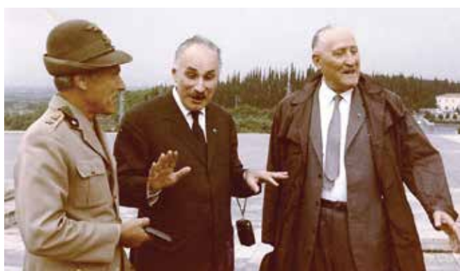
Personaggi governativi in visita a Redipuglia.

Ma il ras non aveva fatto i conti con gli alpini che, arrampicatisi nottetempo sulle pareti a strapiom-