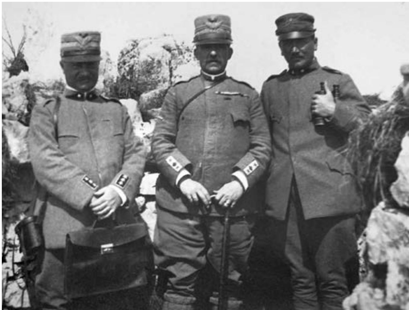
Il generale Montuori in visita sull'Ortigara.

valleresco avversario, dovettero affrontare sacrifici di ogni genere, che misero a durissima prova il loro spirito e la loro capacità di resistenza. A tutti fu richiesta una prova decisiva e ciascuno, in base alla propria esperienza umana, la diede con la massima generosità. Su quelle aspre montagne, consacrate dal sangue dei due eserciti in lotta, alpini, fanti, bersaglieri, artiglieri, genieri, soldati dei servizi logistici e Kaiserjäger hanno scritto pagine di storia eroica che non possono essere dimenticate.