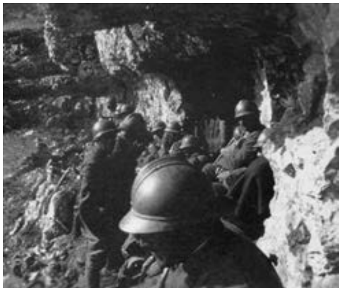
Alpini sotto la cresta dell'Ortigara.

ni Bicocca e Val Arroscia. A rinforzo della difesa, in prima linea, erano schierate otto compagnie di mitragliatrici e quattro batterie di artiglieria da montagna. Altri reparti erano in rincalzo lungo il Costone dei Ponari: il Battaglione Monte Stelvio, il Battaglione Valtellina, il Battaglione Val Tanaro e il III Battaglione del 10° Reggimento della Brigata Regina.