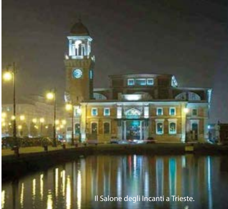
Il Salone degli Incanti a Trieste.