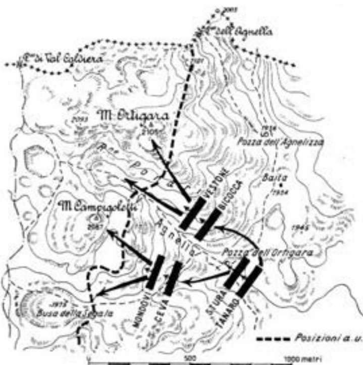
La colonna Cornaro nella giornata del 10 giugno 1917.

Caddero in nostre mani 860 Kaiserjäger, 45 ufficiali, 14 mitragliatrici e 5 cannoni. Anche in questa eroica, tragica giornata i Battaglioni Ceva, Monte Baldo, Bassano, Verona, Val Stura, Val Dora, i fan-