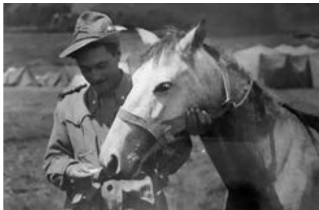
Mulo di Artiglieria Alpina.

"Ci davano sempre da mangiare, poco ma sempre. Comunque avevamo sempre fame". La quan-