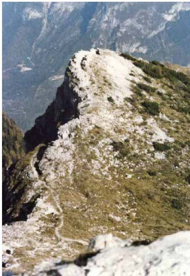
La quota 2003 difesa dal III Battaglione del 37° Reggimento austriaco.

Il nemico non si diede per vinto, l'Ortigara era troppo importante per la difesa dell'Altopiano e della Valsugana al punto che il generale Conrad, comandante del Gruppo Esercito del Tirolo, ordinò "che le posizioni perdute dovevano essere, ad ogni costo, riconquistate".