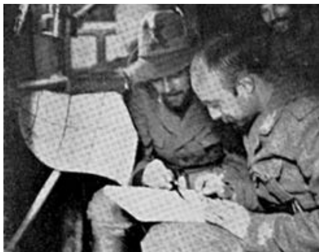
Campagna di Grecia.

Ogni notte però due sagome scure strisciavano verso il luogo della sepoltura, scavavano con le mani la terra, con un cucchiaino tagliavano dei