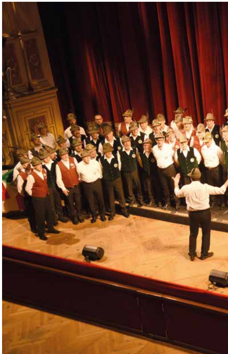
Un momento dell'esibizione canora sul prestigioso palco del Teatro Verdi.

Ma tutto il concerto era dedicato a Sappada: quasi un presagio - ed un auspicio certamente - dell'arrivo di Sappada tra i territori del FVG, novità che ha tagliato il traguardo parlamentare proprio a fine novembre 2017. Un "fuori programma" speciale è stato, così, dedicato a Sappada, il cui ingresso nel Friuli Venezia Giulia è stato salutato da un grande applauso, ascoltato in diretta dal