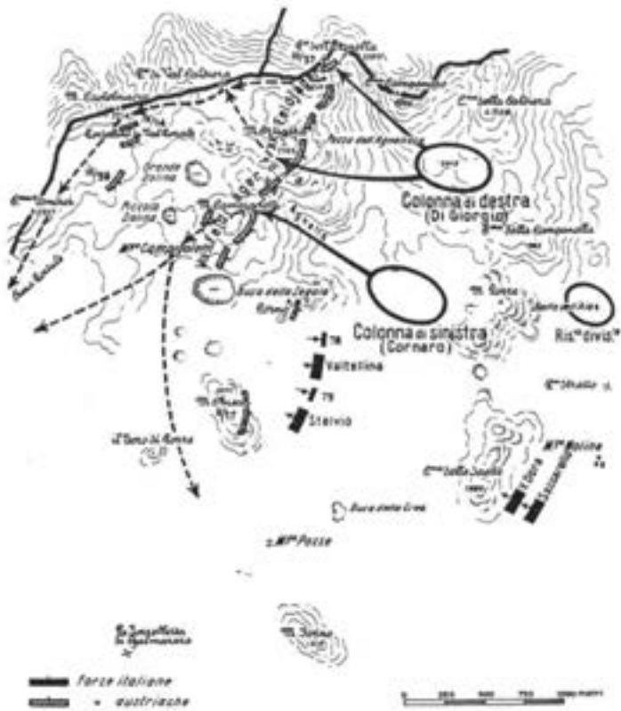
Gli ordini della 52ª Divisione per il giorno 10 giugno 1917.

Totale forze impegnate per l'attacco: 29 Battaglioni, 8 compagnie mitraglieri, 4 compagnie del genio e 2 gruppi di artiglieria da montagna.