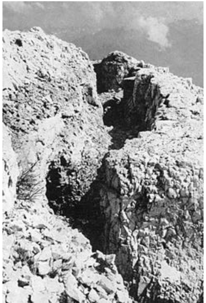
Trincerone austriaco di quota 2101.

Nella giornata del 18 giugno l'artiglieria sottopose ad un violentissimo bombardamento le difese austriache, in particolare le posizioni tenute dalla