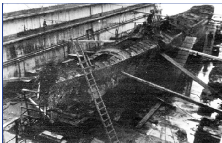
La carcassa dello Jalea recuperata dopo l'affondamento