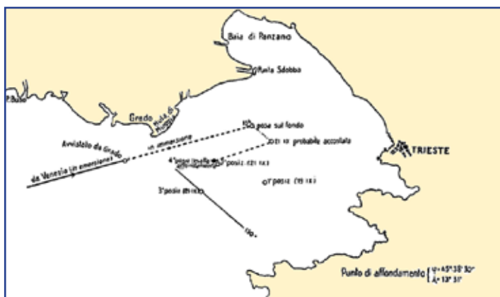
Zona dell'operazione ed affondamento