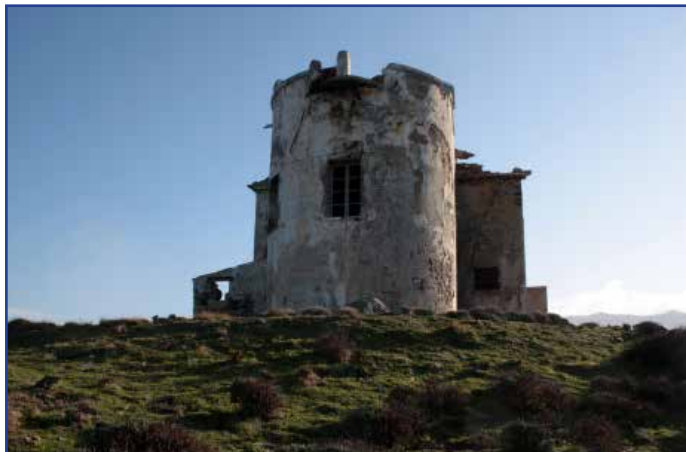
Semaforo marittimo di Grado