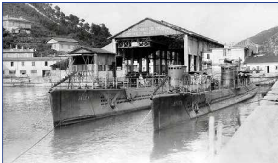
Il sommergibile Jalea a sinistra nella foto.