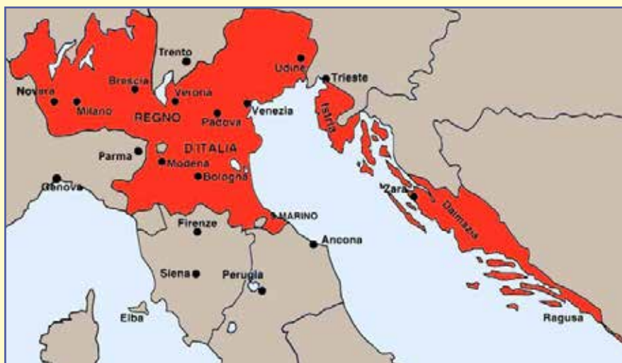
Il Regno d'Italia formato da Napoleone

Una notevole recrudescenza si verificò con la nascita del Regno d'Italia nel 1861. L'Austria iniziò ad