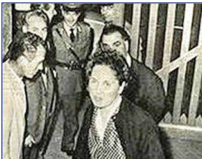
All'uscita dal carcere a Firenze

avuto luogo in concomitanza con la firma del trattato. Per l'occasione, la guarnigione britannica era stata schierata davanti alla sede del comando ed il generale De Winton fu invitato a passarla in rassegna.