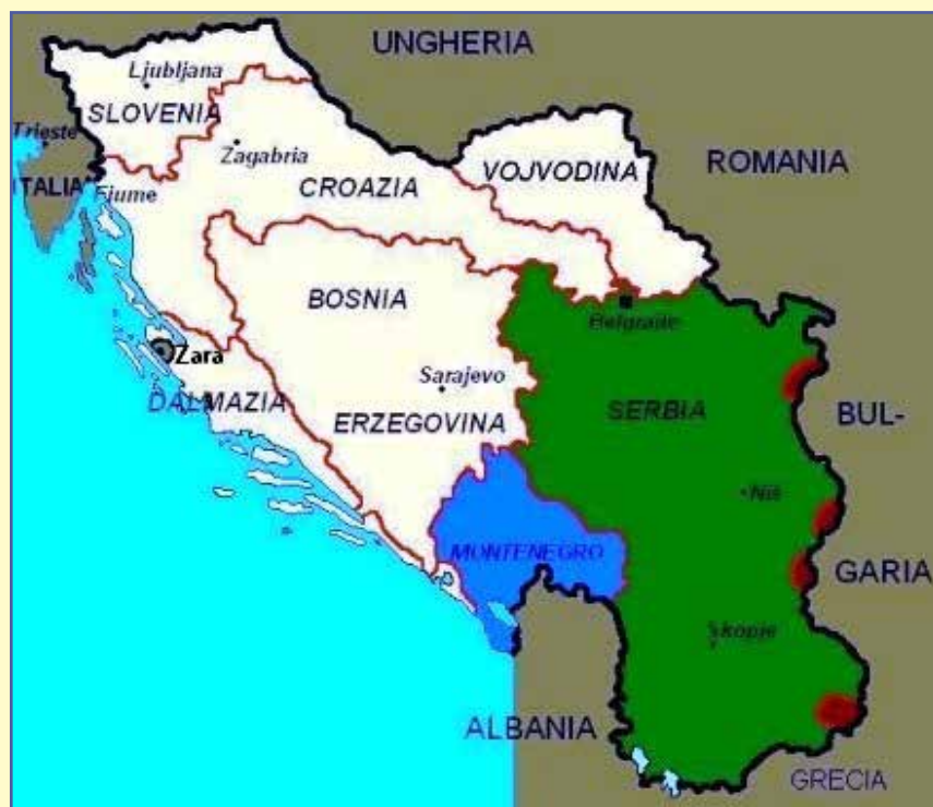
Il Regno dei Serbi, Croati e Sloveni

Il sistema persecutorio austriaco sempre più duro e la tracotanza slava provocavano un continuo flusso di famiglie italiane costrette a riparare in Italia o in altri Stati.