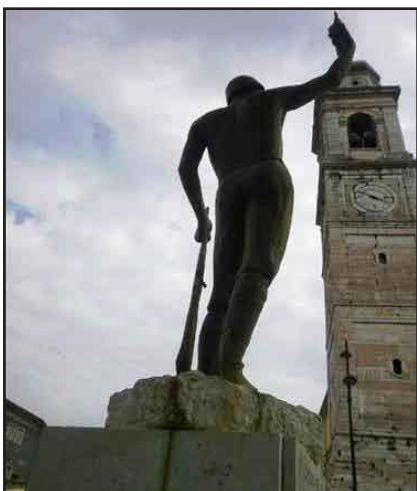
Monumento ai Caduti