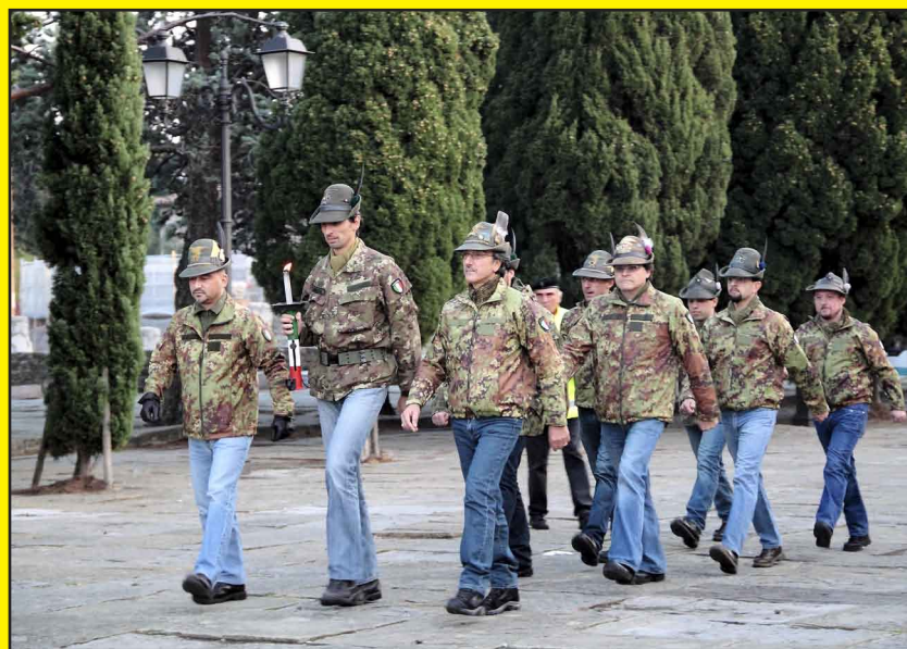
San Giusto - Sopra: arrivo della Fiaccola Sotto: cerimonia del 2 novembre