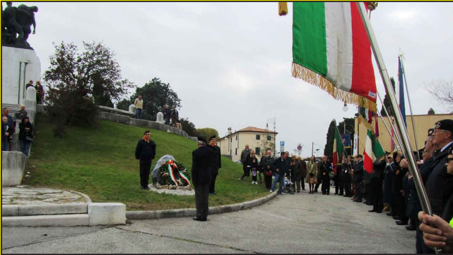
Cippo dedicato ai "Ragazzi del 99" restaurato dall'Associazione Artiglieri d'Italia

Altro tour de force l'indomani 4 novembre con la partecipazione della Sezione alle cerimonie a Redipuglia e con alzabandiera ed ammainabandiera in Piazza Unità d'Italia.