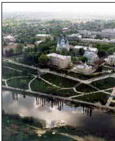
La città di Tambov oggi

In quel periodo venne la commissione a passarci la visita, veniva una volta al mese per assegnarci le categorie.