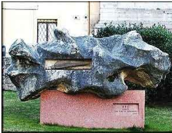
Monumento dedicato dall'ANA ai Caduti

sociazioni d'Arma di quel piccolo paese, oltre alla giunta comunale, l'avevano messa lì venerdì, ma poi la pioggia e il vento l'hanno fatta cadere e volare via.