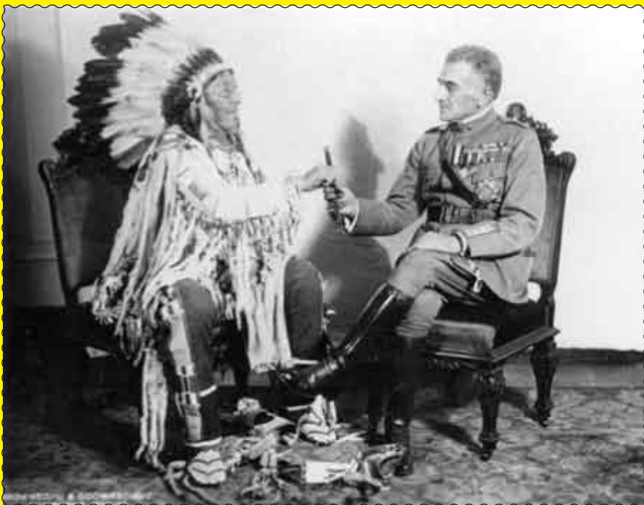
Se si fosse accontentato di una penna sola ... avremmo potuto farlo alpino!

"Il generale Diaz - scriveva un giornale americano