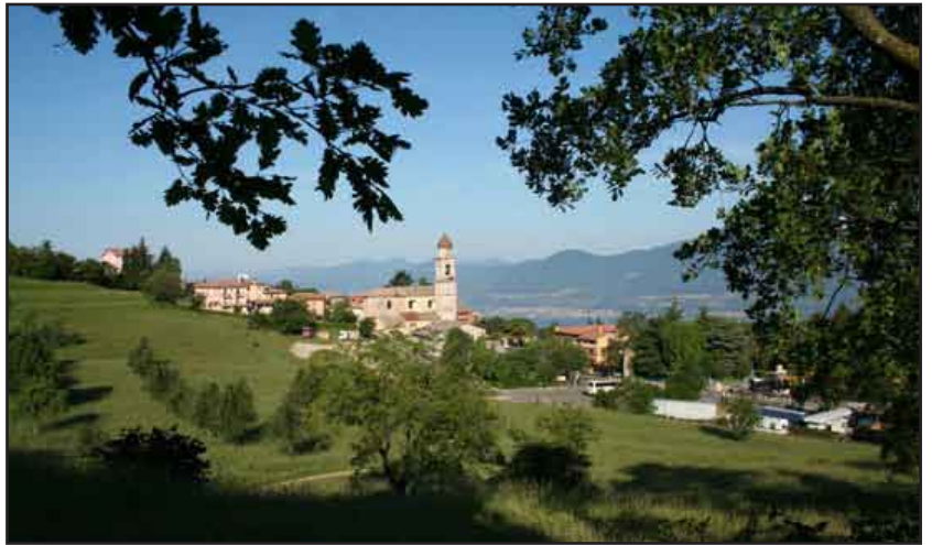
San Zeno di Montagna (Lago di Garda)

Il monumento rappresenta un bel soldato in piena euforia, con l'elmetto ben fisso ed il fucile alto e sveltante al cielo. E sotto c'era una corona di alloro con le palline dorate ... la classica commemorazione per il ricordo della fine della guerra; solo che era caduta per terra a qualche metro di distanza con le palline dorate sparpagliate intorno. Si vede che gli alpini e altre As-