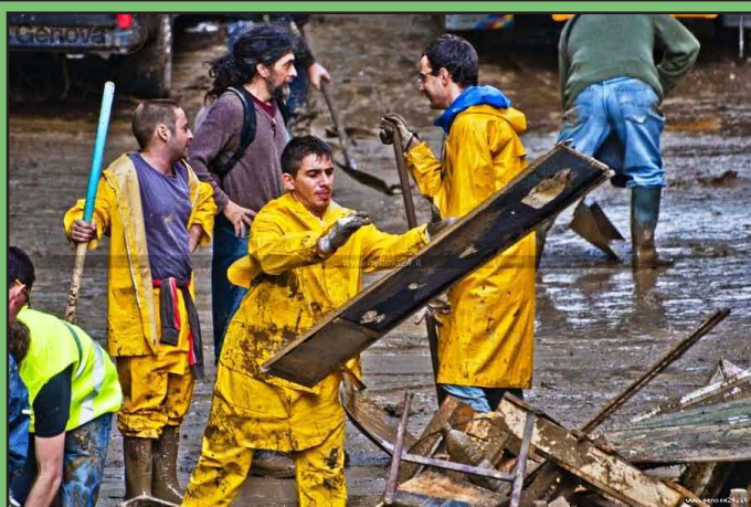
Giovani volontari nelle strade di Genova

hanno prima preso il telefono ed hanno chiamato i Municipi, i comandi del Vigili del Fuoco, di Polizia, dei Carabinieri, lasciando il loro recapito telefonico mettendosi a disposizione per dare una mano.