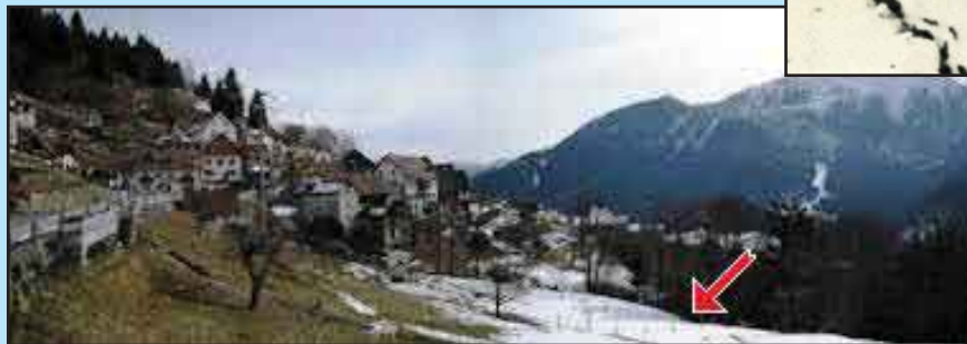
La probabile (?) zona dell'esercitazione a fuoco.

Mio cugino chiese notizie sull'arma e contro chi stessero sparando. L'alpino ci spiegò che era un'esercitazione e che sparavano a salve contro altri alpini che al braccio portavano una fascia rossa. Immediatamente - chissà perché? - io provai un'istintiva antipatia per i rossi!