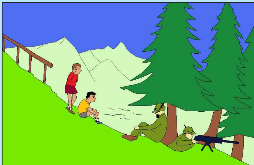
La scena ... più o meno la ricordo così. Non portavano l'elmetto ma il cappello alpino.