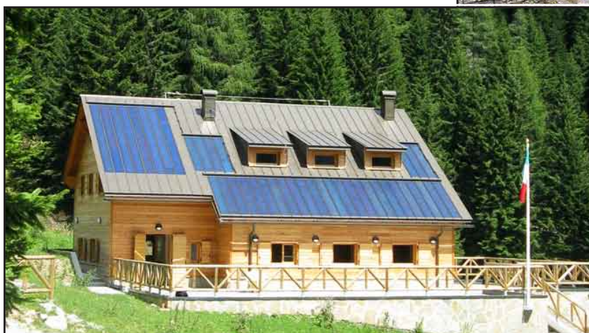
Le tre fasi del rifugio: in alto a sinistra la capanna del 1930, qui sopra il rifugio del 1948 e, nella foto qui a sinistra, l'attuale rifugio