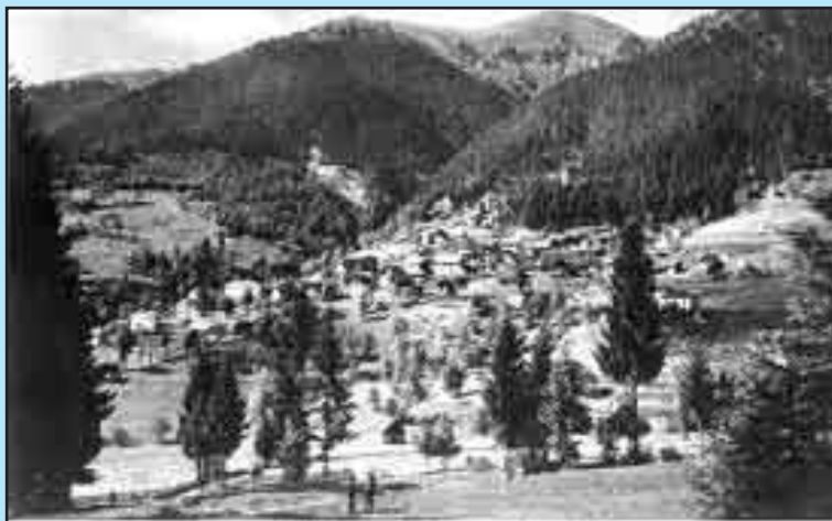
Ravascletto, com'era una volta

Un giorno che eravamo a Ravascletto con il sacerdote notammo una strana animazione ed allegria in paese. Ben presto ne scoprimmo il motivo: su per la strada stava arrivando una colonna di alpini con i loro muli. Ovviamente corremmo a vederli passare: io li trovai fantastici mentre li ammiravo con gli occhi spalancati dalla meraviglia e dalla gioia. Mi sembravano enormi, maestosi ed emanavano forza e sicurezza. C'era un gran rumore di zoccoli, di scarponi e dei carichi sui basti che ondeggiavano ad ogni passo. Io ne ero letteralmente affascinato: erano i primi alpini, anzi i primi soldati italiani che vedevo, a parte i carabinieri al valico di confine del Lisert.