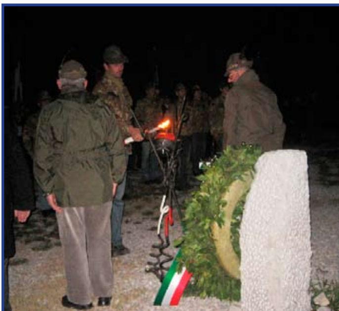
Sotto: il tedoforo accende il tripode alla Foiba di Basovizza

Il giorno dopo la Sezione ha partecipato alla Santa Messa per i Caduti a San Giusto, e quindi il 4 novembre all'alza ed ammainabandiera in Piazza Unità d'Italia ed alla deposizione di una corona d'alloro da parte della Lega Nazionale sul pronao della chiesa di Sant'Antonio Taumaturgo il giorno 5, in ricordo dei Caduti del novembre 1953 per l'italianità di Trieste.