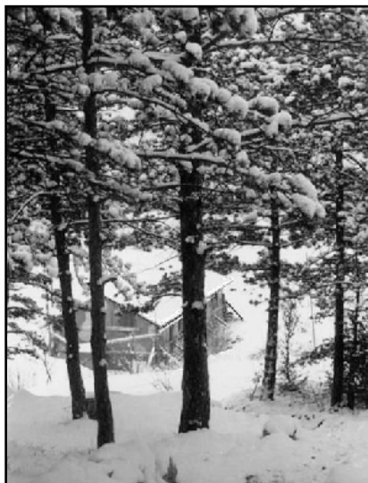
Capanna sede del Comando batteria