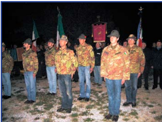
Sopra: la pattuglia di scorta alla fiaccola.

Il mese di novembre ogni anno è particolarmente ricco di avvenimenti per la nostra Sezione. Il primo immane appuntamento è costituito dalla Fiaccola Alpina della Fraternalità che, partita da Aquileia, va ad accendere fiamme votive al Cimitero Austroungarico di Campo Sacro, alla Risiera di San Sabba, al Monumento ai Caduti sul colle di San Giusto per terminare alla Foiba di Basovizza. Vengono così onorati i Caduti civili e militari di entrambi le guerre mondiali. Si veda a pag. 11 l'articolo di Federico Toscan.