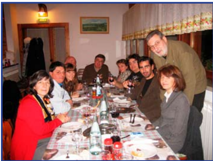
Sopra: convivio di forumisti a Samatorza Sotto: due foto della Cena degli Auguri