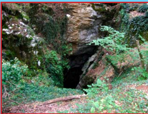
Una foiba nei pressi di Basovizza

Quando, il 10 febbraio, renderemo onore alle vittime italiane delle foibe, dovremo rivolgere un breve pensiero anche a tutte le vite che il furore dell'odio, con bestiale ferocia, ha mietuto anche altrove a guerra finita, indiscriminatamente contro uomini inermi, vecchi, donne e bambini.