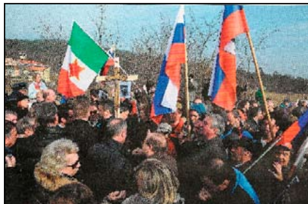
Stella rossa contro il Crocefisso