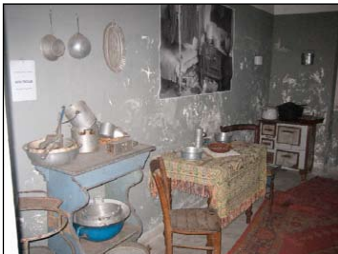
Due locali del Campo Profughi di Padriciano, mantenuti così come erano al tempo dell'esodo

meno per far fronte all'enorme flusso di visitatori. Onestamente però dobbiamo ammettere che un tale flusso di visitatori è stato una sorpresa per tutti e nessuno poteva aspettarselo.