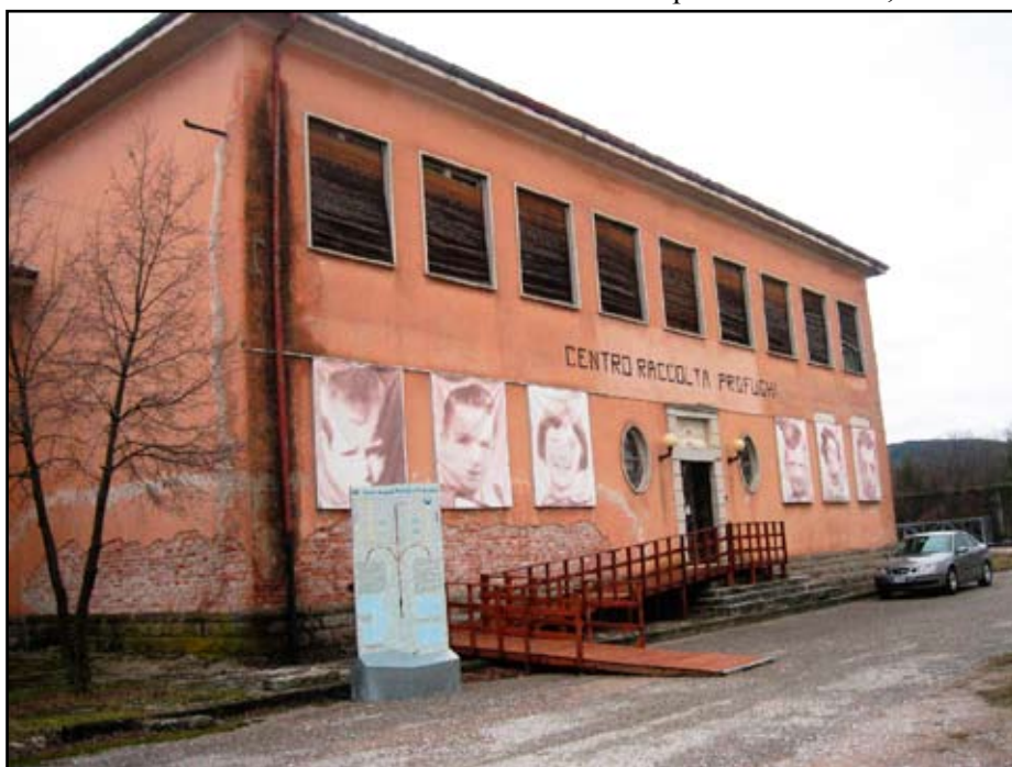
L'edificio centrale del Campo Profughi di Padriciano

Per non parlare della sistemazione della Foiba di Basovizza e l'adiacente Museo, rivelatosi non confacevole alle necessità. Né per le cerimonie, né tanto-