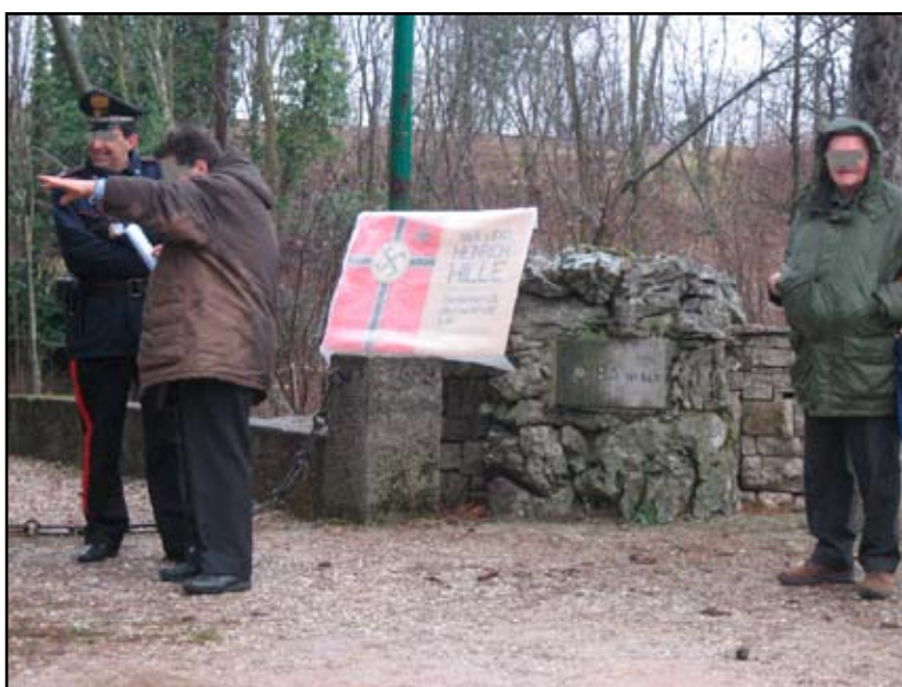
Patetici provocatori della minoranza slovena di Trieste

Ma noi siamo Alpini, e le brache non le caliamo. Vogliamo la pace, ma senza ipocrisie, senza vigliacche cortine di silenzio sulla realtà storica. E vogliamo che ai nostri martiri degli eccidi del nazio-