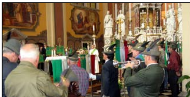
La Santa Messa in Duomo