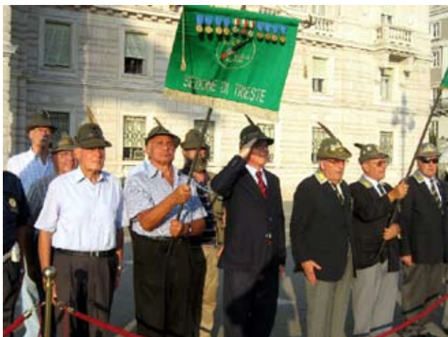
Ammainabandiera in Piazza Unità d'Italia

Settembre ed ottobre sono stati due mesi di intensa attività per la nostra Sezione, a cominciare dall'Ammainabandiera il giorno 4 in Piazza Unità d'Italia, per proseguire poi coi pellegrinaggi al Valderoa, Monte Grappa e Monte Tomba, ed al Faro di Monte Bernadia sabato 6 e domenica 7 settembre.