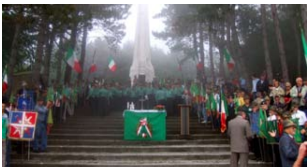
Cerimonia sul Monte Bernadia