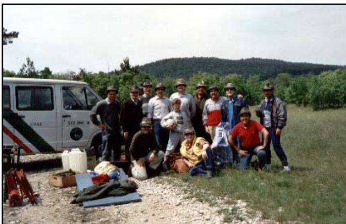
1989: la prima edizione del TROFEO DALL'ANESE