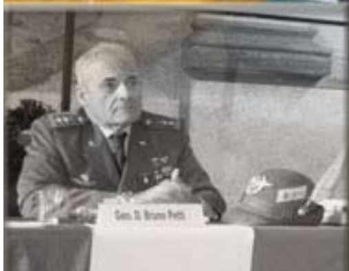
GEN. PETTI, UN TRIESTINO AL COMANDO DELLE TRUPPE ALPINE