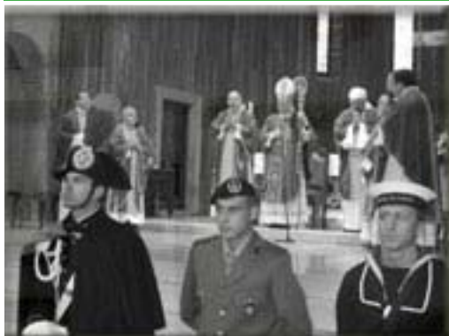
SAN GIUSTO: PRECETTO PASQUALE PER LE FORZE ARMATE

Bimestrale inviato gratuitamente a Soci e Sezioni A.N.A. Anno XXXII n.139 MAGGIO 2008