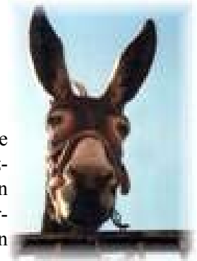
SONO CALMO E TRANQUILLO, MA NON FATEMI INCAVOLARE

Poi li manda a raccogliere la spazzatura a Napoli!