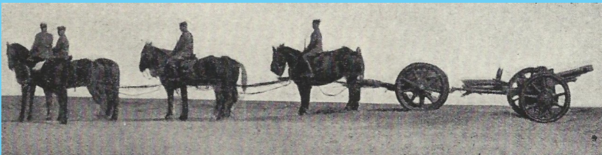
Obice da 75 al traino