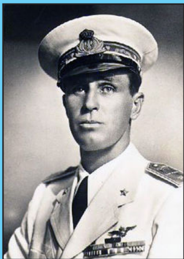
Amedeo di Savoia duca d'Aosta

Nel '36, in una cerimonia solenne svolta all'ippodromo di Montebello, il 23° Reggimento “Timavo” e il