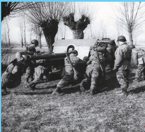
Messa in batteria