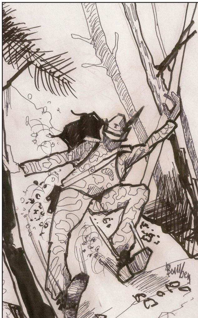
Illustrazione del pittore triestino Ottavio Bomben, eseguita per questo racconto