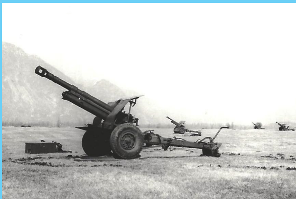
La 2ª batteria schierata nei pressi di Osoppo.