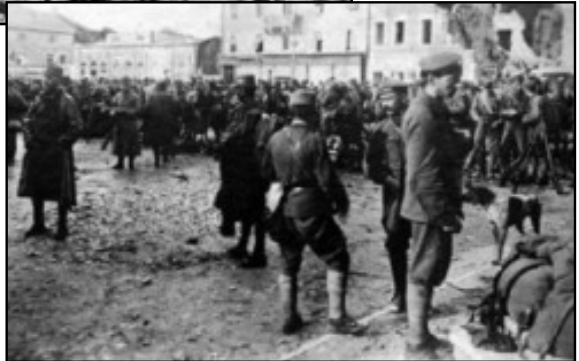
Truppe austriache a Monfalcone riconquistata dopo Caporetto