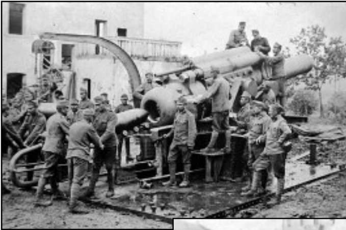
Castagnevizza, obice austriaco in azione contro la Terza Armata