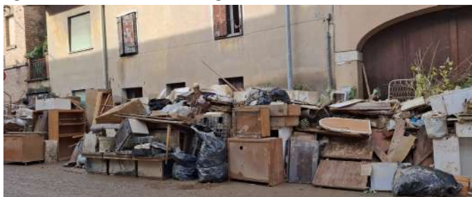
uno scorcio di Versa, come fu trovata dai volontari

I volontari che in gioventù erano intervenuti in occasione tragico sisma del 1976, hanno osservato come anche in questo caso la popolazione, messa in ginocchio ma non piegata, ha reagito con grande dignità rimboccandosi le maniche senza segni di rassegnazione od autocommiserazione, e dovunque si vedevano gli abitanti, coperti di fango, scopare infaticabilmente la melma fuori da porte e cortili e sostenuti, in molti casi, dalla fattiva collaborazione di parenti ed amici giunti dal resto della regione.