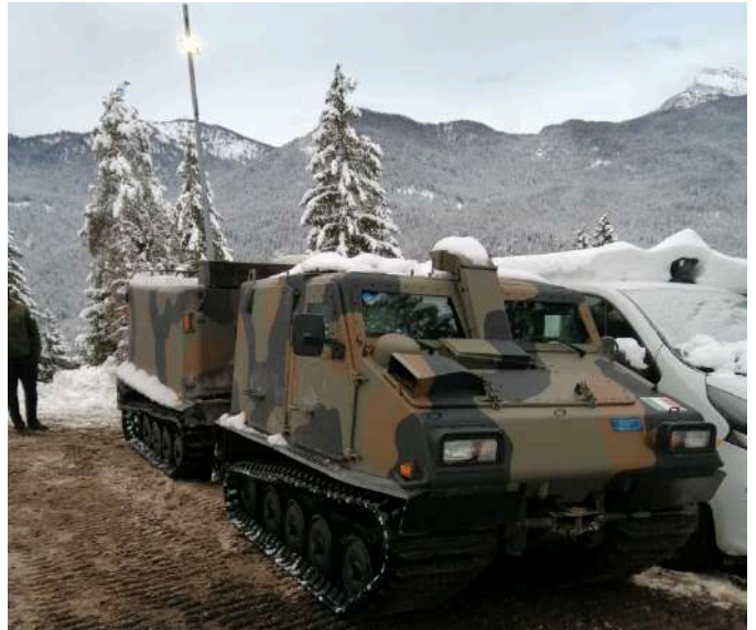
Il cingolato BV 206 degli Alpini utilizzato nelle due due giornate di neve