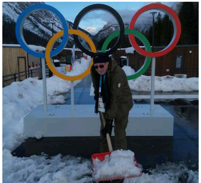
l'Autore mentre spala neve al Villaggio Olimpico