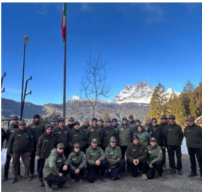
Foto di gruppo dopo l'alzabandiera al Villaggio Alpino