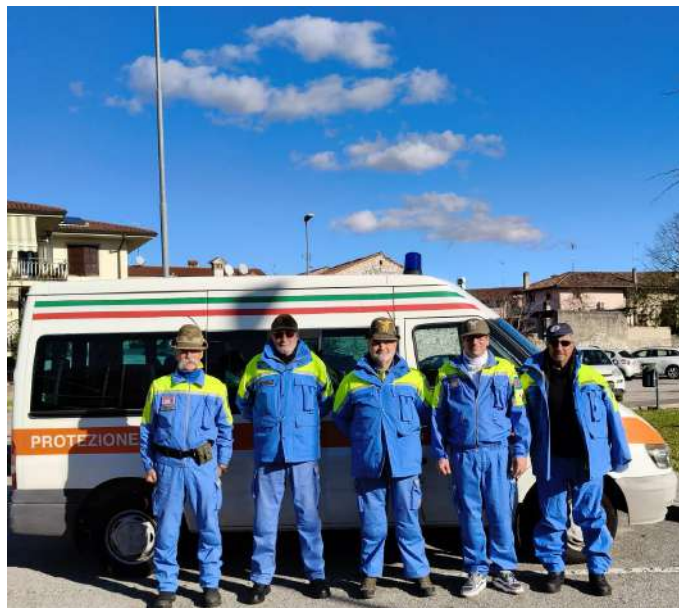
alcuni dei volontari della Squadra PC ANA TS che si sono alternati nei vari turni a Versa.

Oltre alle devastazioni patite ai piani terra, a Versa si contarono dozzine di veicoli sepolti fino al tetto e, nei giorni successivi, si assisterà al triste spettacolo di vedere le auto rimorchiate dai carri attrezzati per essere portate dagli sfasciacarrozze mentre delle scavatrici, dotate di apposite benne, rimuovevano le catoste di mobilia ed elettrodomestici per scaricarli su camion diretti alla discarica.