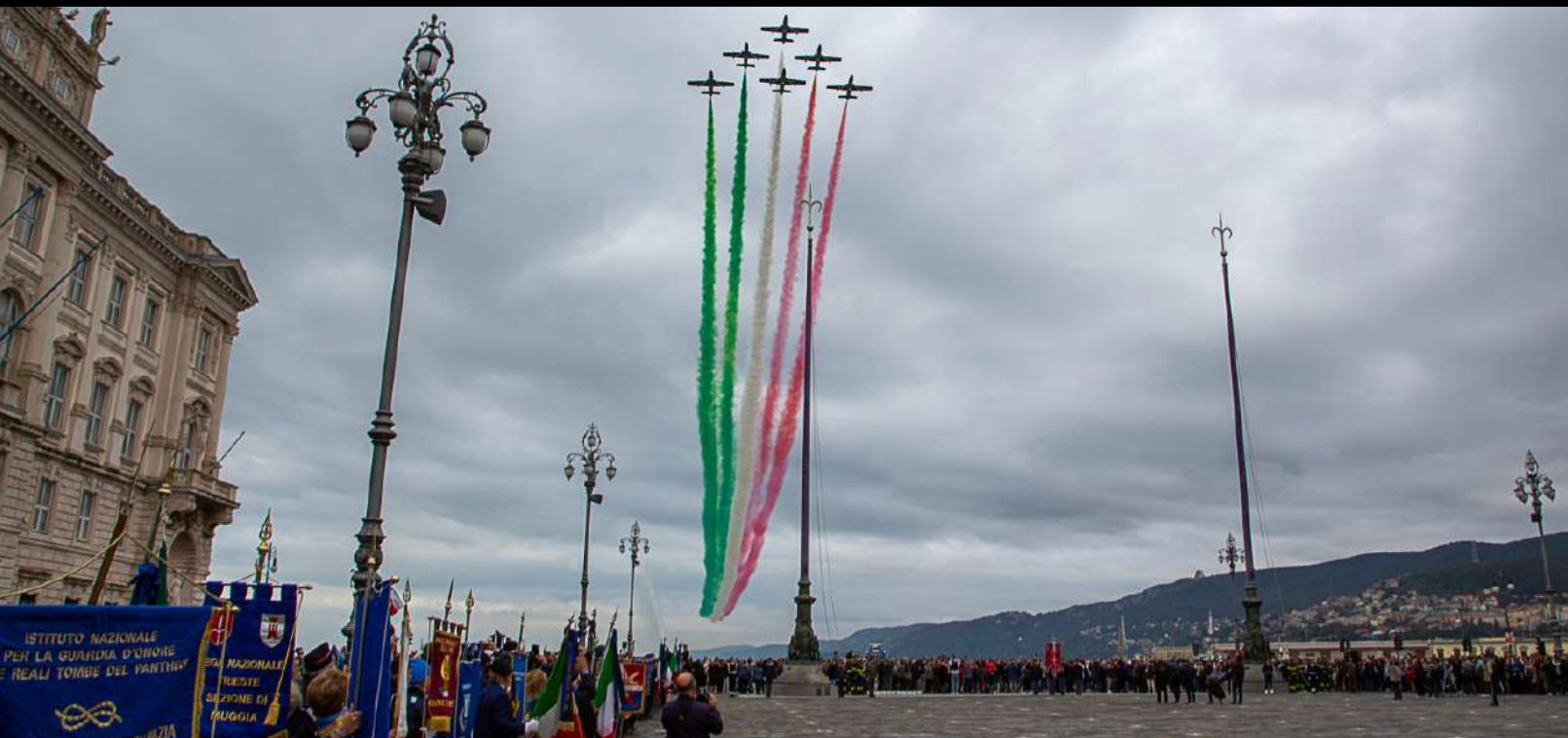
TRIESTE - 26 OTTOBRE 2024

Trimestrale inviato gratuitamente a Soci e Sezioni A.N.A.