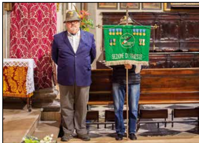
Chiesa Beata Vergine del Rosario.