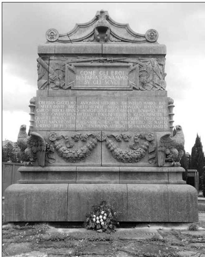
L'Ara progettata dall'architetto Polli posta sopra la "cripta dei Volontari" nel 1929.

E per sua iniziativa, per desiderio delle madri, per volontà vostra, volontari, sorse sull'avello che custodisce le 79 salme benedette l'austero monumento disegnato da Carlo Polli, che nella nobiltà del concetto, nella classicità della forma, nella vigoria delle linee e nell'armonia dei colori interpretò con animo di combattente l'impulso di idealità che infiammò tante giovinezze".