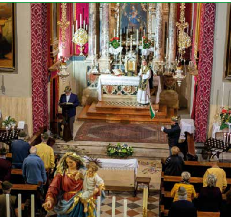
Chiesa Beata Vergine del Rosario.

Nella chiesa Beata Vergine del Rosario (Piazza Vecchia) è stata celebrata la S. Messa in commemorazione dei caduti e nel 150° anniversario di costituzione delle Truppe Alpine.