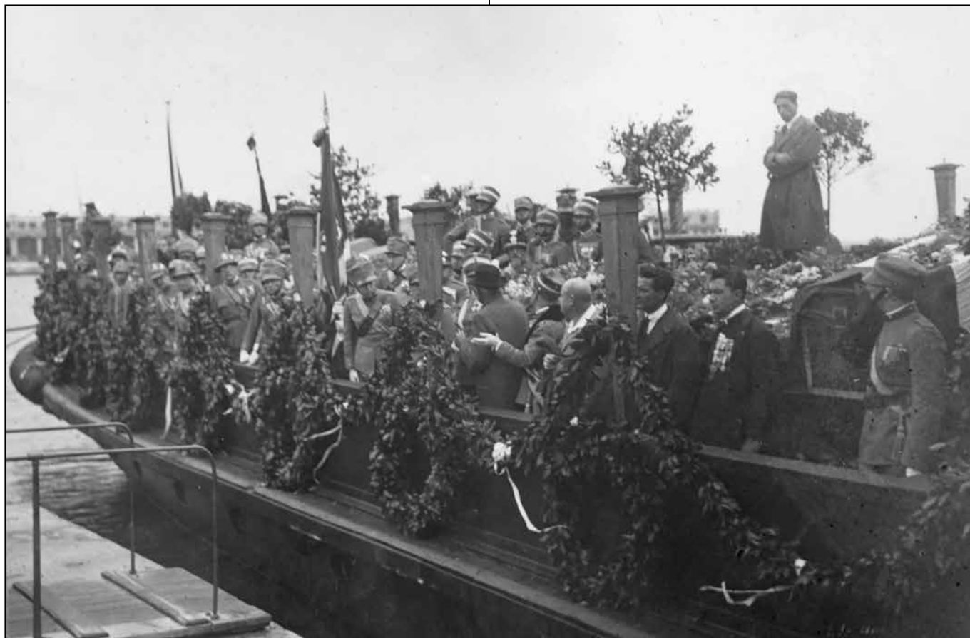
In alto, Trieste 16 giugno 1923. Arrivo del rimorchiatore Nettuno del Lloyd Triestino da Monfalcone. Sulla coperta i feretri di 35 volontari Caduti, la scorta d'onore della Compagnia volontari e rappresentanti di istituzioni e associazioni.