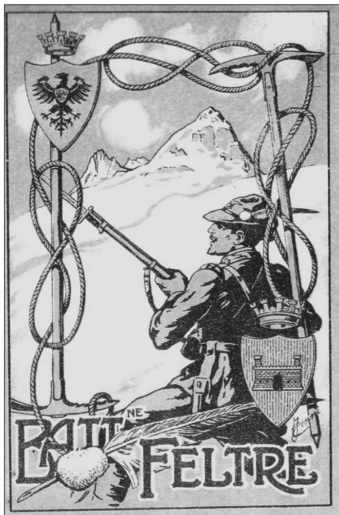
Una delle cartoline del battaglion Feltre. Sullo sfondo il Cauriol.