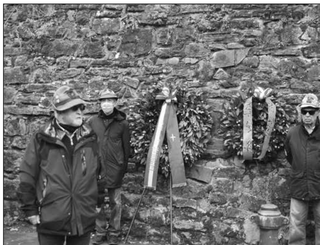
Gli alpini rendono omaggio ai caduti triestini e austriaci.