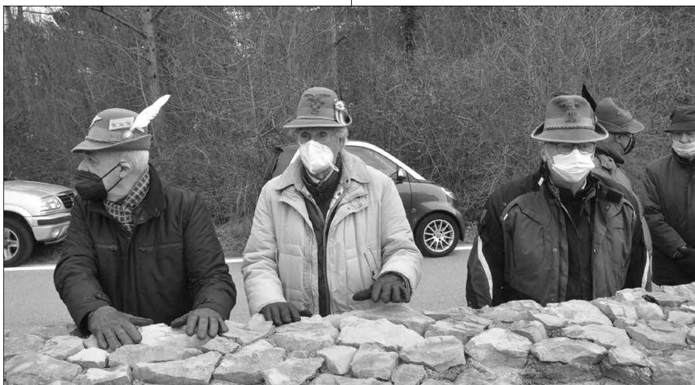
I nostri alpini presenti "all'esterno", dietro il muretto.