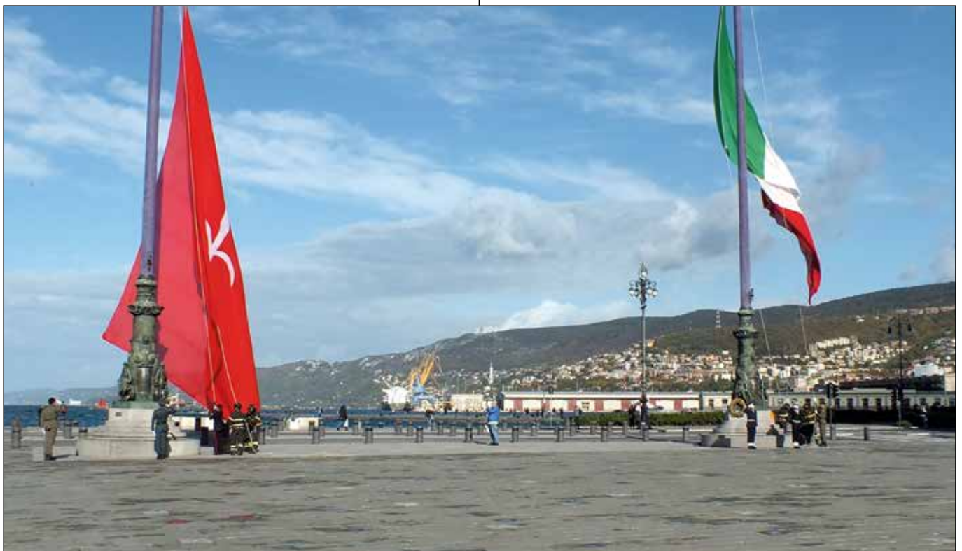
4 novembre, l'alzabandiera in piazza Unità d'Italia.

Il 2 novembre in Italia viene celebrato il ricordo dei morti. Siamo andati a San Giusto e abbiamo deposto