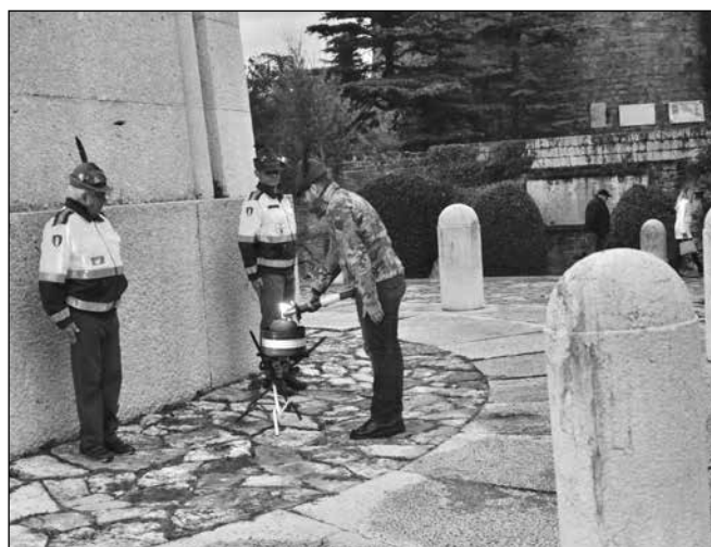
La fiaccola a San Giusto a Trieste.