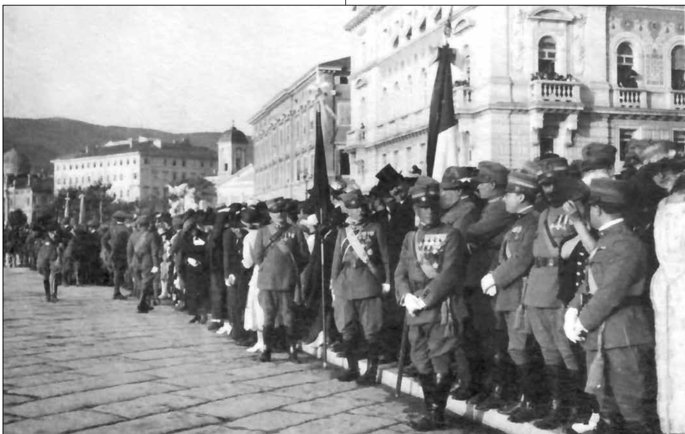
Sotto, la folla sulle Rive in attesa dell'attracco del Nettuno.