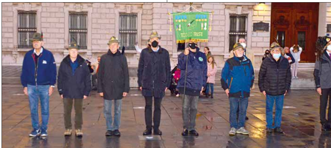
Gli alpini triestini all'ammaina bandiera.