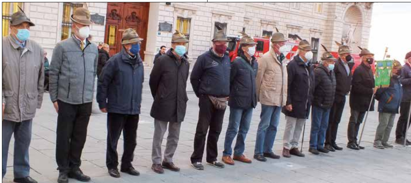
Gli alpini in piazza Unità d'Italia a Trieste il 4 novembre.

una corona d'alloro al monumento ai Caduti. Finita questa cerimonia i partecipanti, assieme alle altre associazioni combattentistiche e d'arma, si sono recati, sempre a San Giusto, sotto la lapide che ricorda i concittadini morti combattendo nelle fila dell'esercito austro-ungarico, deponendo un mazzo di fiori.