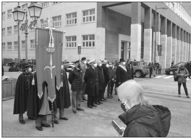
... ancora il gonfalone.