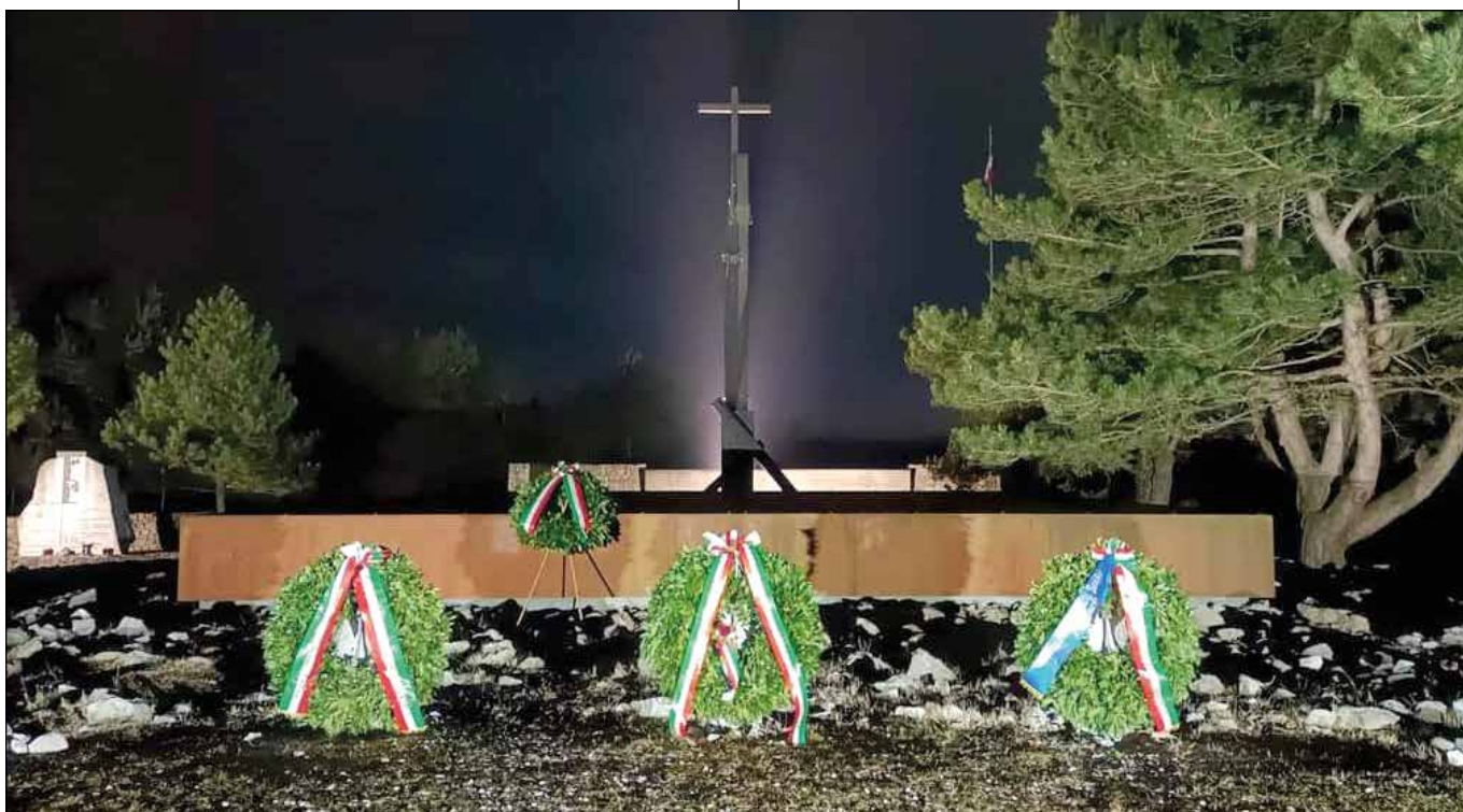
La Foiba di Basovizza in una suggestiva immagine notturna.

gradevole: cielo poco nuvoloso, temperatura buona per il periodo e assenza di vento. Chi c'è stato può capire. Giornata gradevole dicevo ma atmosfera surreale. Si perché all'interno del Sacriario eravamo in pochi e tutti rispettosi delle regole mentre all'esterno, dietro il muretto, le "penne nere" facevano da corona. Il Comune di Trieste, organizzatore della cerimonia, ci aveva imposto una rigida cerimonia con pochi, anzi pochissimi partecipanti e per questo motivo abbiamo dovuto scoraggiare tutti coloro che ci avevano chiesto di partecipare.