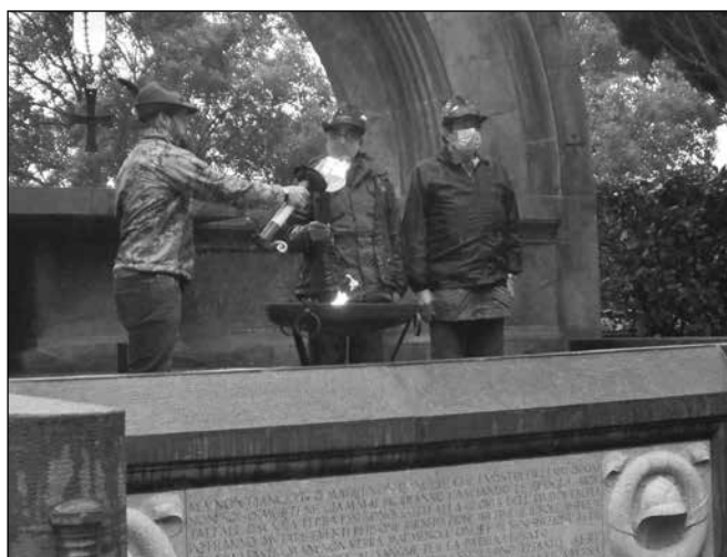
La fiaccola ad Aquileia il 1° novembre.