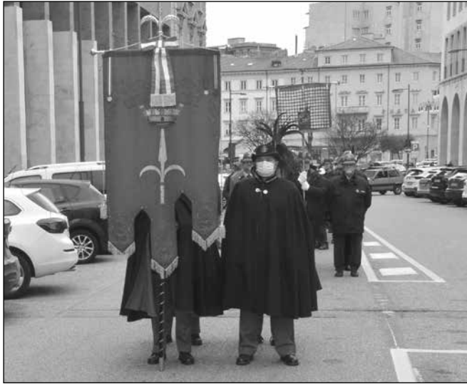
Il gonfalone della Città di Trieste.