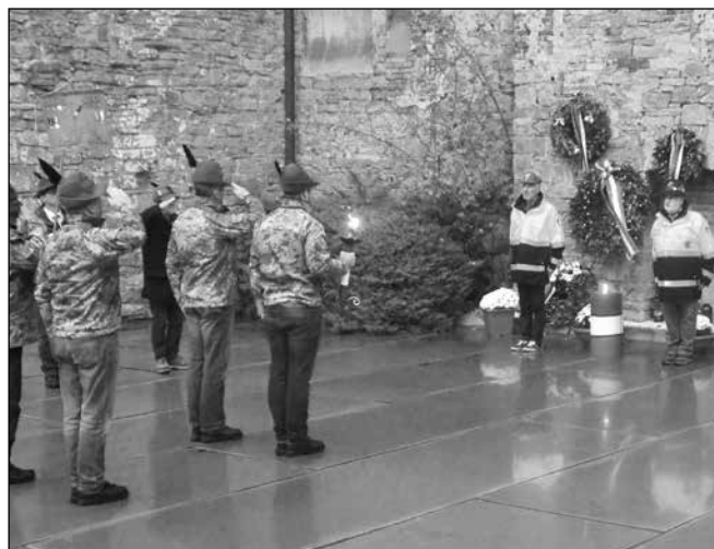
La fiaccola alla Risiera di San Sabba.