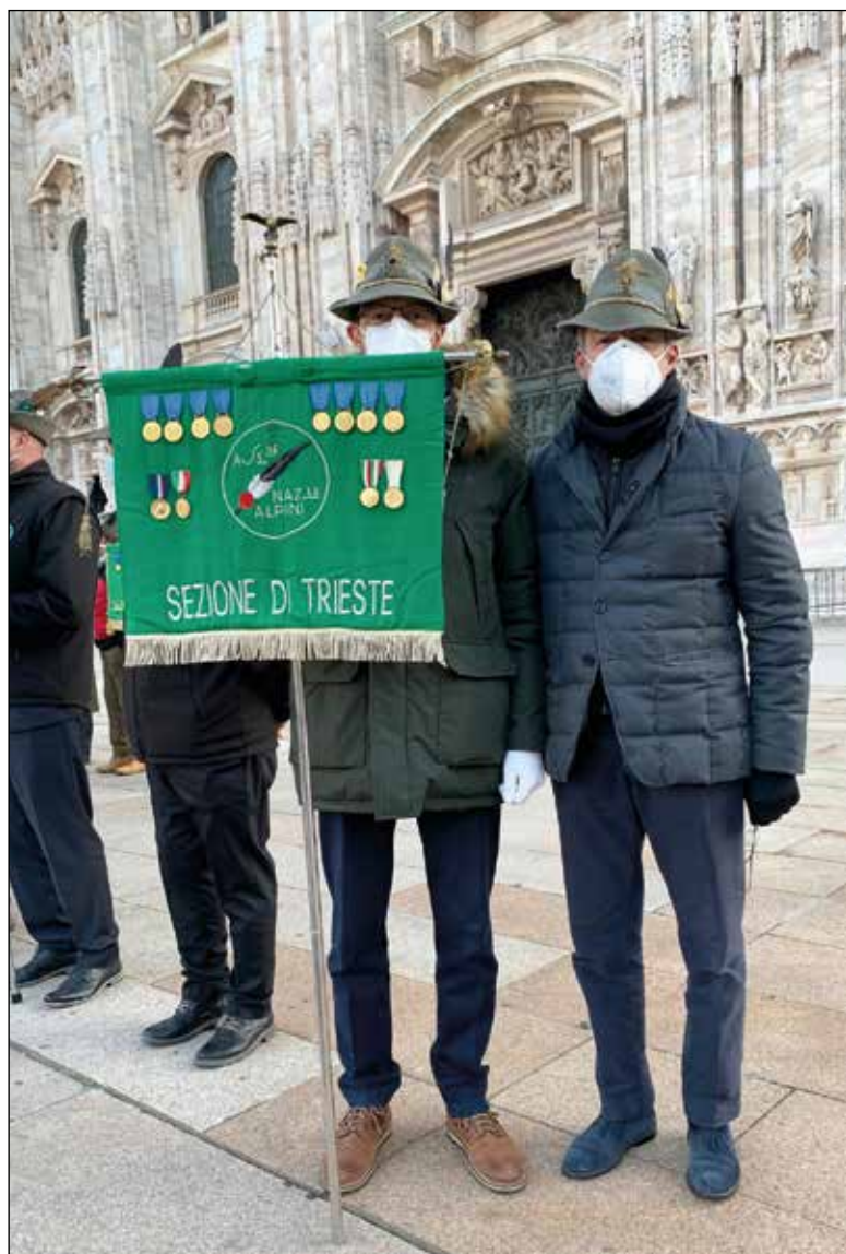
I nostri rappresentanti a Milano.

La Santa Messa è stata officiata da Mons. Luca Raimondi, Vicario Generale della Diocesi milanese, che nell'omelia non ha mancato di sottolineare lo spirito di fratellanza e di solidarietà cristiana che caratterizza da