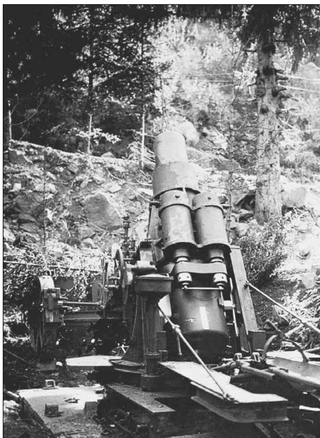
Il famoso obice Skoda da 30,5cm piazzato a Zanolin di Ziano di Fiemme che spediva le sue "sbibole" sulle postazioni italiane del Cauriol.