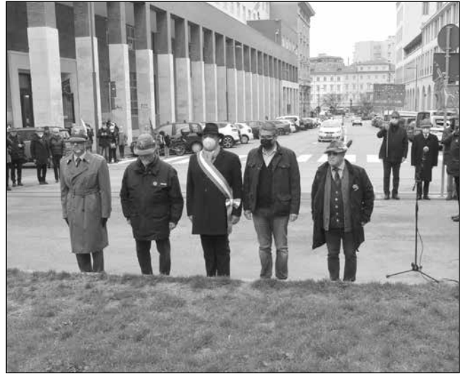
Le autorità civili e militari.