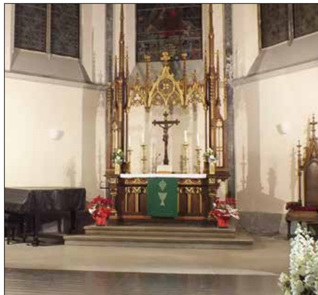
L'altare nella chiesa Luterana.

Naturalmente il tutto si è concluso nella nostra sede con un brindisi e con un'altra "cantada".