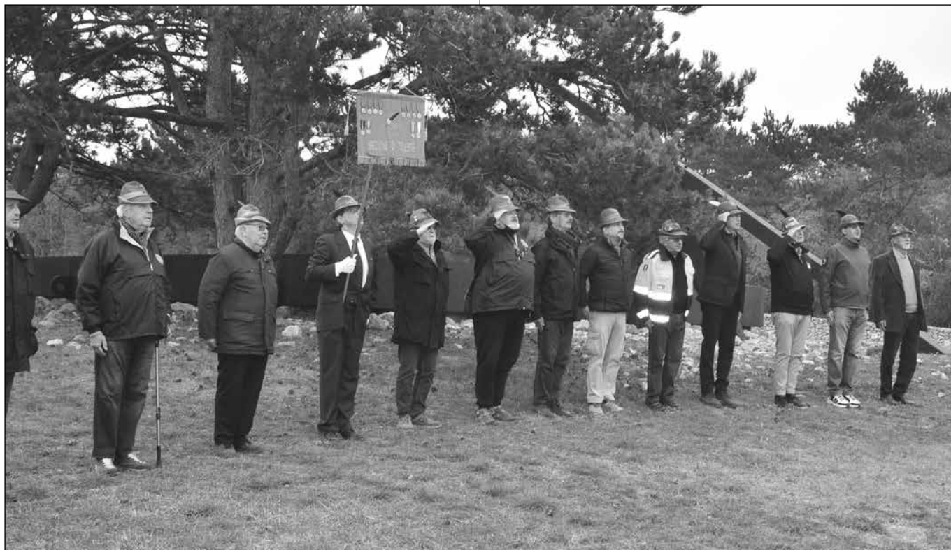
L'alzabandiera a Basovizza il 1° novembre.