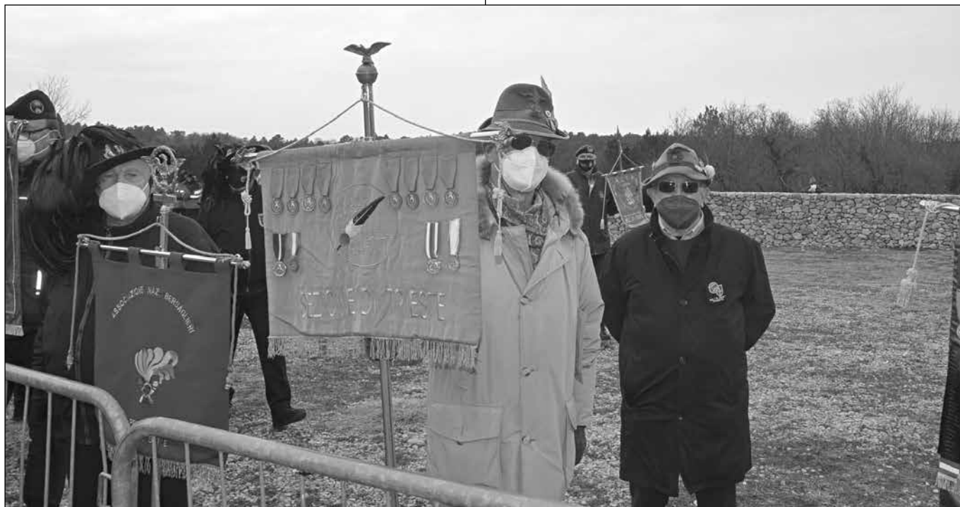
Il vessillo alla Foiba di Basovizza.

La cerimonia inizia con l'alzabandiera da parte di due alpini in armi e due alpini della nostra Sezione. Poi la deposizione di tre corone d'alloro; la prima delle istituzioni (Sindaco di Trieste, Prefetto e Presidente della Regione F.V.G.), la seconda del presidente del comitato martiri delle foibe e la terza delle associazioni degli esuli istriani, fiumani e dalmati.